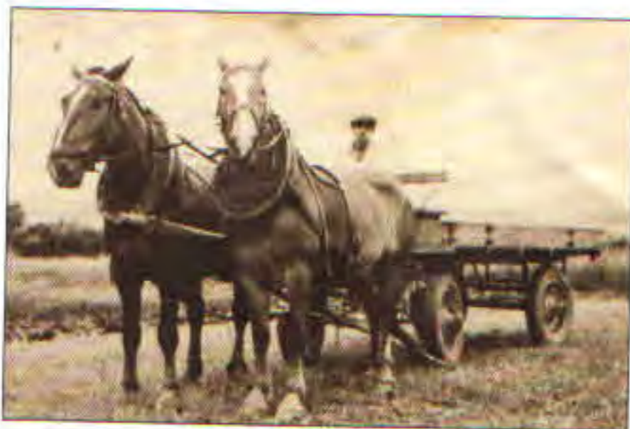
Práce na poli s koňským povozem