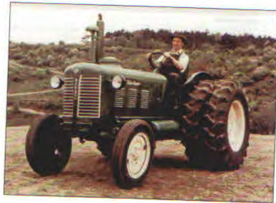
Traktor Zetor Super