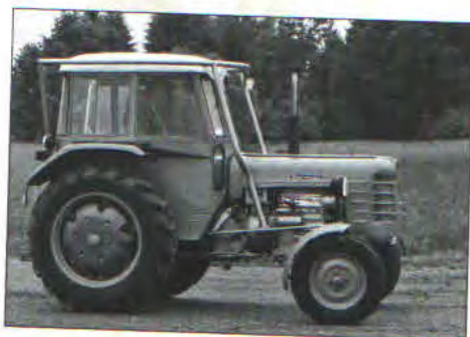
Traktor Zetor 3011