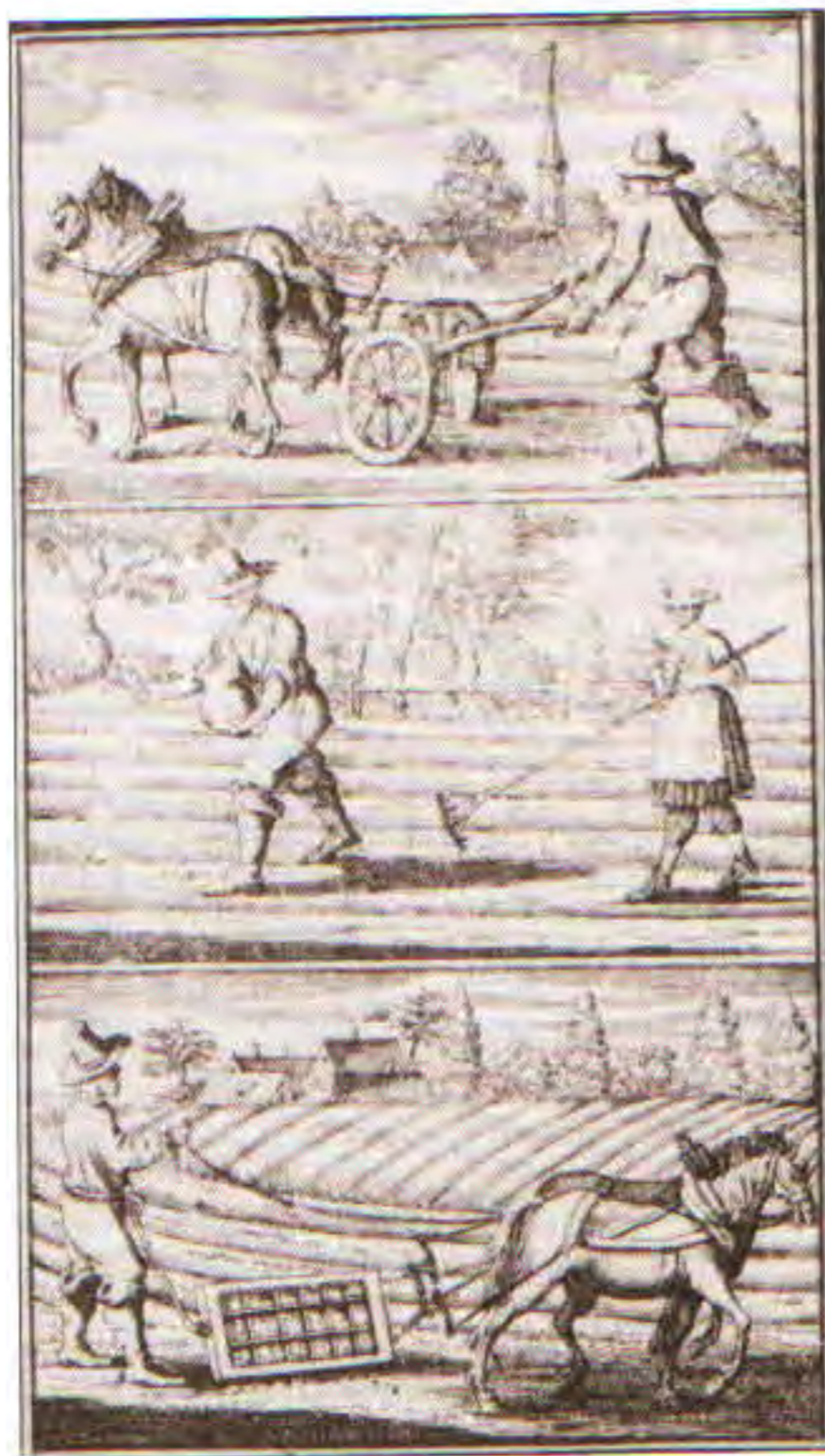
Orání, setí a vláčení z knihy G. Mayera, vydané v Norimberku 1730

zela v Bezuchově. Podle konskripčních sumářů z roku 1843 tu žilo 89 mužů a 90 žen, dohromady 179 osob ve 30 domech se 46 byty. Z nich se zabývalo 44 rodin zemědělstvím, dvě rodiny řemeslem. Obvyklá strava sestávala z mléka a moučných jídel, luštěnin a hlíz, dvakrát v týdnu bylo masité jídlo a výjimečně se jedlo také různé pečivo z mouky, pilo pivo a pálenka. Větší hospodářství měla jednoho pacholka a jednoho pohůnka a děvečku.