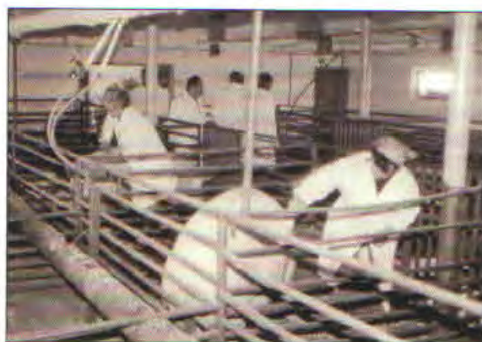
↑ Vepřín v Oprostovicích