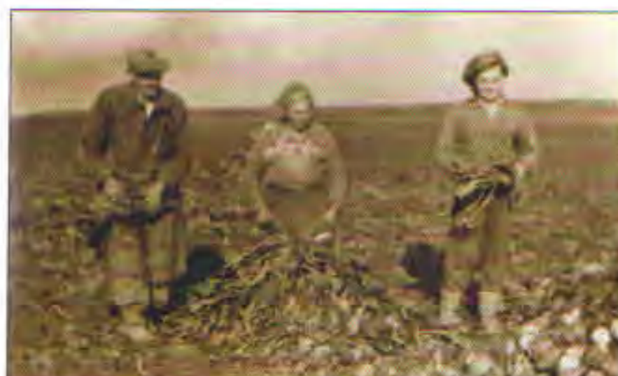
Sklizeň řepy po vzniku místního JZD, asi 1957

V první polovině 20. let 20. století byly z hlediska hospodářského významné dvě události. V rámci pozemkové reformy dostala obec příděl půdy od velkostatku Vidláč,