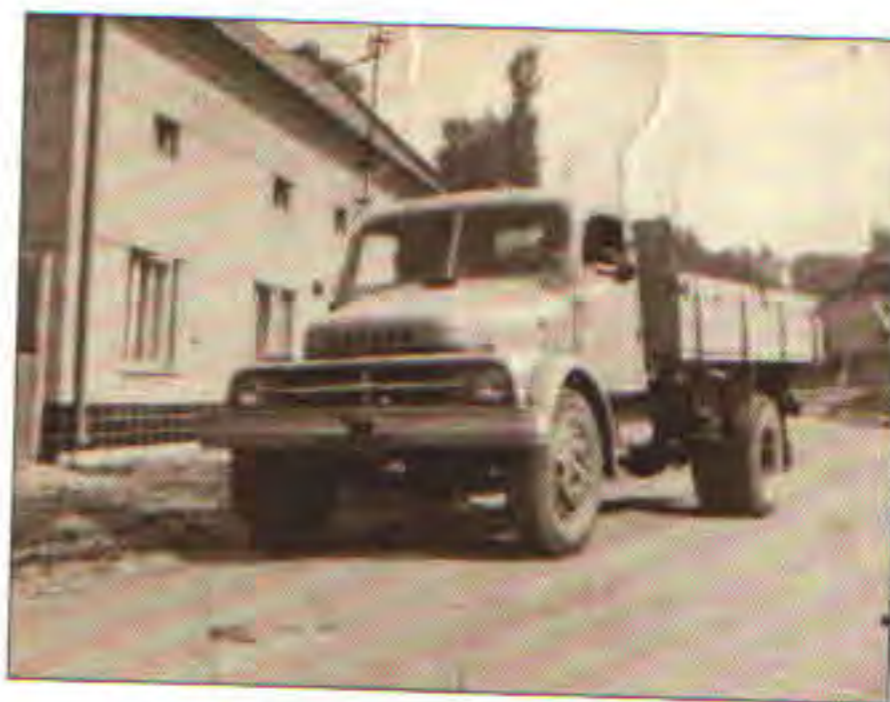
Nákladní automobil PRAGA S5F - Super