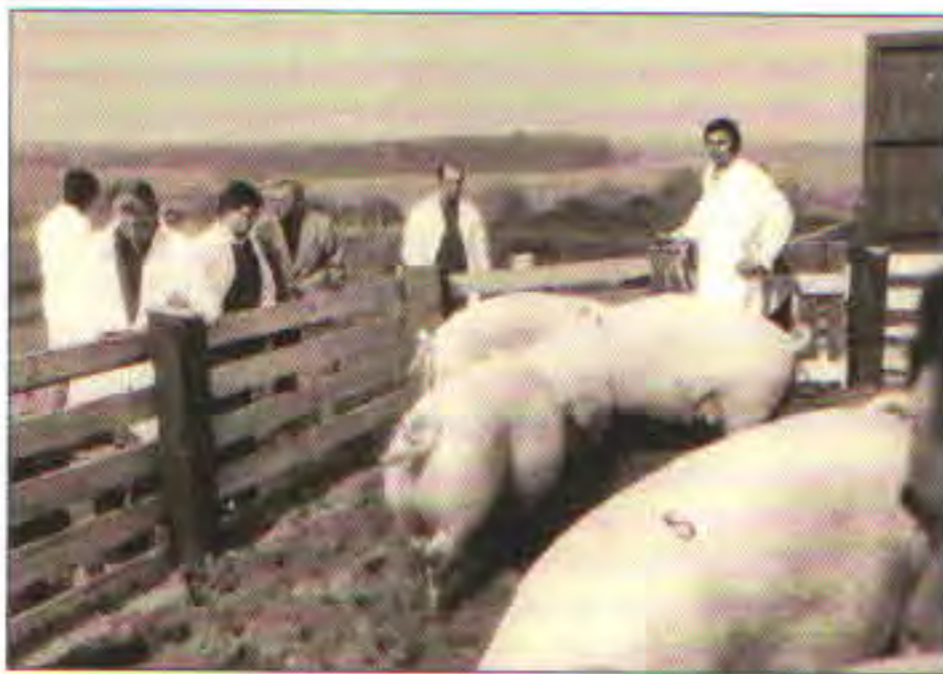
Teletník v Oprostovicích ↓

Dne 6. srpna 1959 se usneslo představenstvo JZD a rada MNV o stavbě kravína pro 80 dojnic, který začali v říjnu stavět dělníci maďarské národnosti. V následujícím roce se začalo s výstavbou vepřína pro 200 kusů prasat. V únoru 1961 se do kravína ustajovaly dojnice. Tato stavba velmi pomohla při