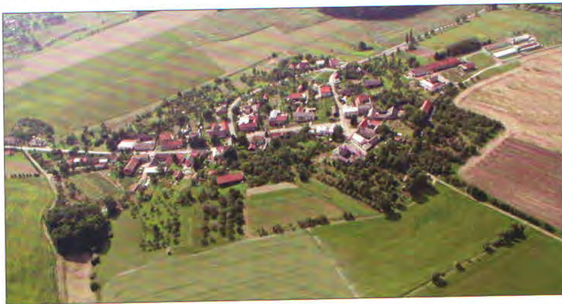
Letecký pohled na Oprostovice, v pravém horním rohu budovy bývalého areálu JZD

První historickou zprávou o Oprostovicích je zápis v Zemských deskách olomouckých, k nimž majetkově patřili zemanští držitelé. Roku 1348 zajistil Jezdoň z Oprostovic své tchyni paní Ofce z Oprostovic 50 hřiven grošů, které jí náležely podle věnného práva. Během staletí se tu střídaly zemanské rody, největšího rozkvětu dosáhly v patnáctém století, které ale bylo zároveň i koncem slávy oprostovických vladyků. Podle nejstarších olomouckých berňových registrech (výkazy výběřčích, kolik vybrali peněz) z roku 1516 lidé v Oprostovicích, Tučíně, Pavlovicích a Prusínkách neplatili, protože byli poddaní výběřčího daní rytíře Václava Pavlovského. Dvůr Mikuláše Maška v Oprostovicích dával 1 zl. 4 gr.