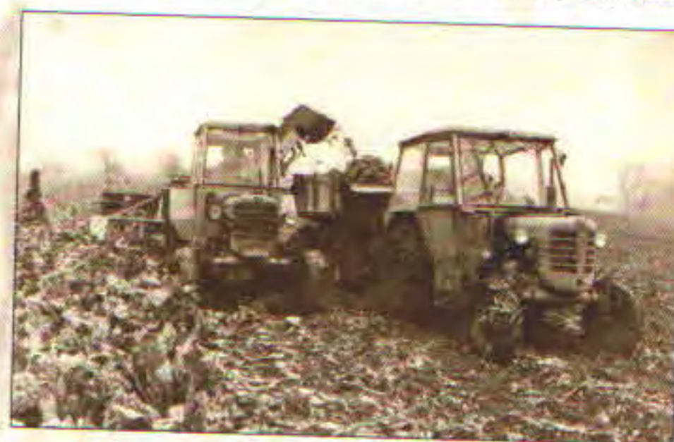
Traktory při sklizni cukrovky, 70. léta 20. stol.