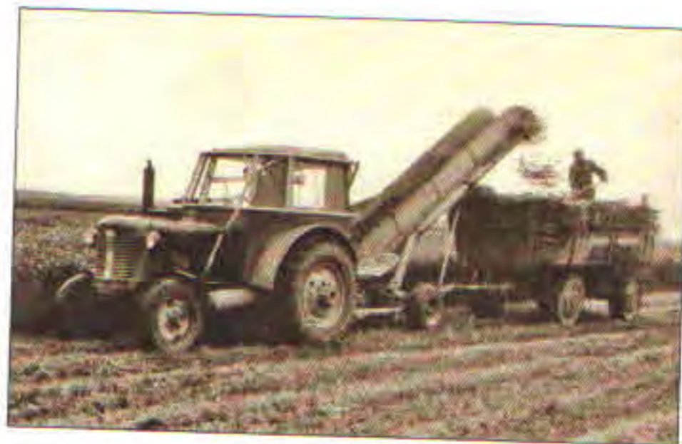
Sečení zeleného krmení, 70. léta 20. stol.