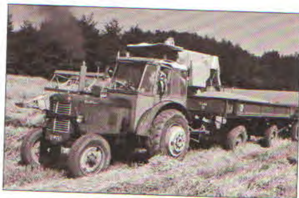
Traktor ZETOR 50 Super