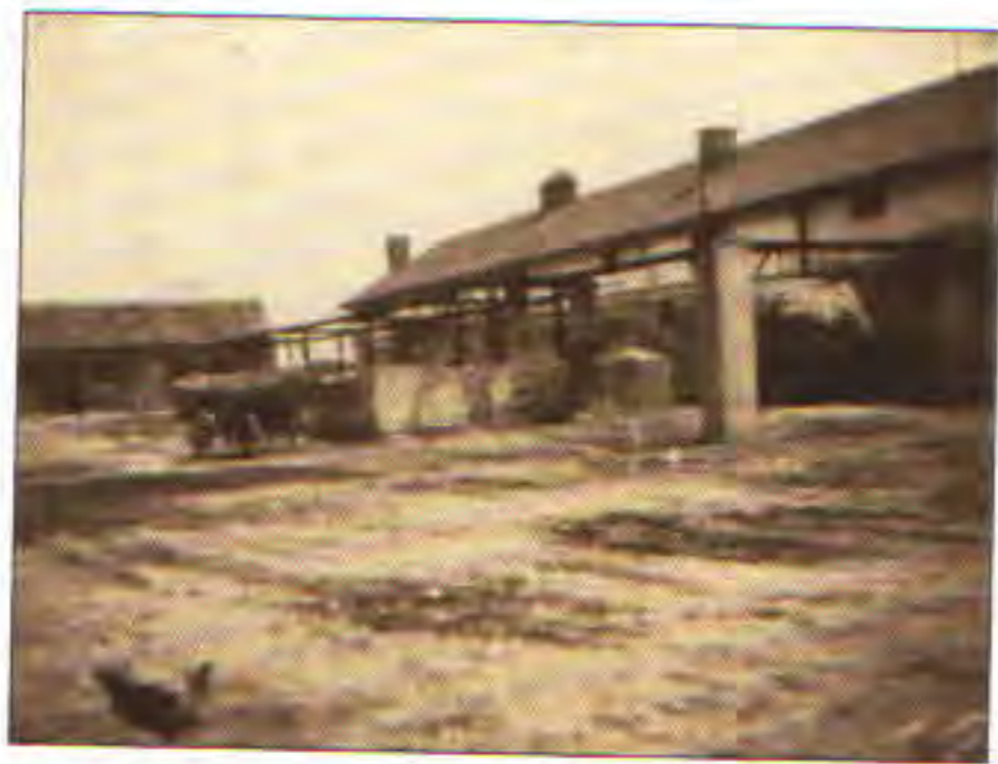
Dvůr v JZD

a srpy, vidle na seno a na hnůj, hrábě, motyky, rýče a lopaty, skoby a cepy. Jarní práce začínaly v polovině dubna, podzimní práce uprostřed září, žně na začátku srpna, seno-seč na konci června. Pěstovala se kvalitní pšenice, ale ostatní obilniny měly jen průměrnou kvalitu a byly žádány jak v obci, tak na trhu. Krmivo z luk a pastvin bylo zde ceněno nejen vzhledem ke kvalitě, nýbrž ještě více kvůli potřebnosti. Dobrá kvalita modřínů a dubů měla za následek neustále zvětšování jejich vysazování, a přesto nestačily zdejší