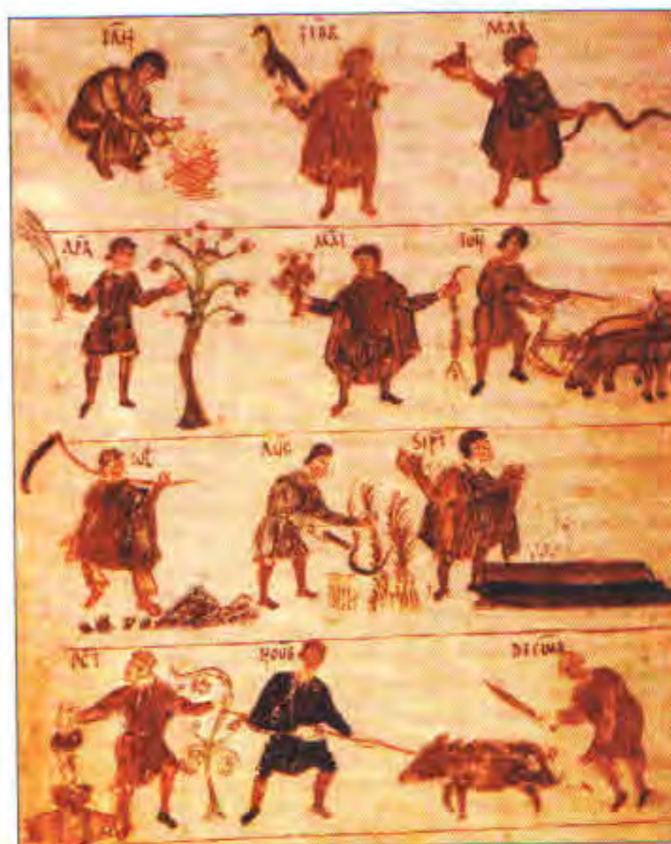
Zobrazení zemědělských prací v průběhu roku, rukopis z r. 818