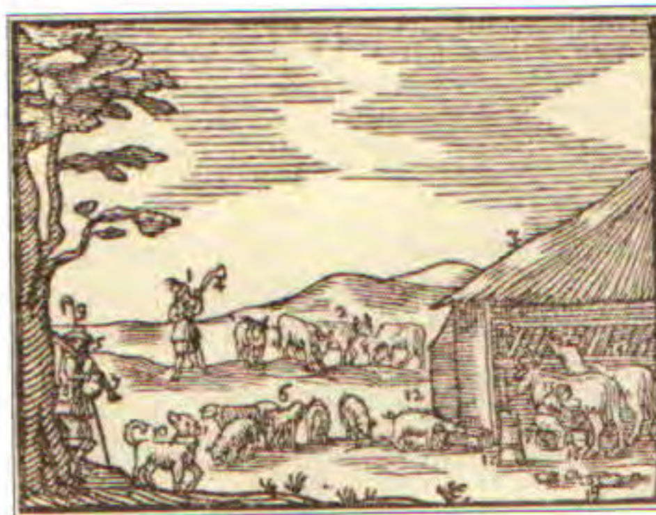
Vyobrazení chovu dobytka v knize J. A. Komenského, Orbis sensualium pictus , Norimberk 1659