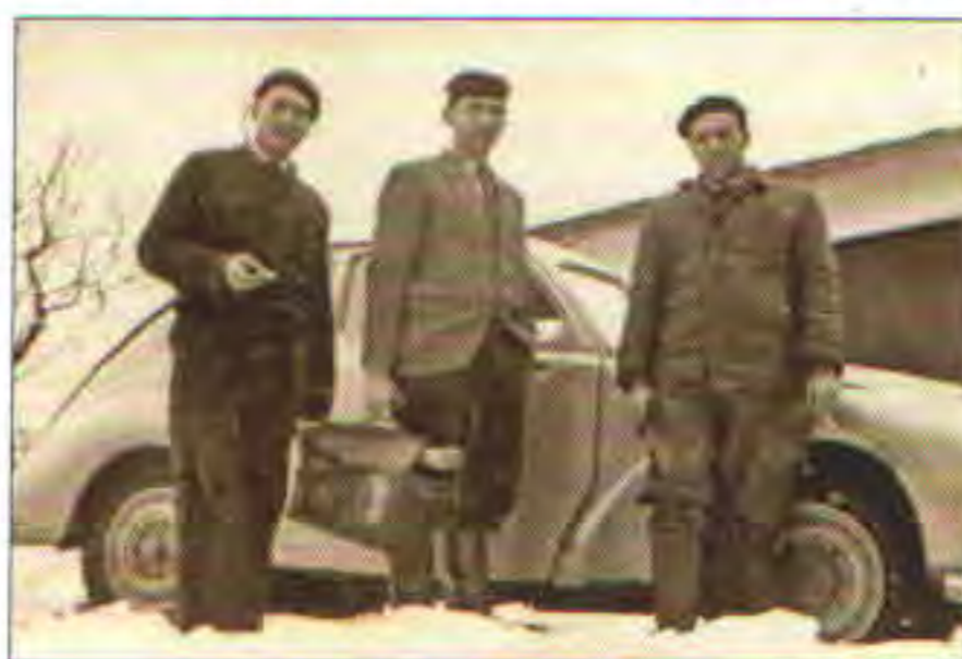
Členové družstva, asi 1957