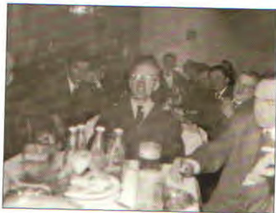
Schůze JZD Oprostovice