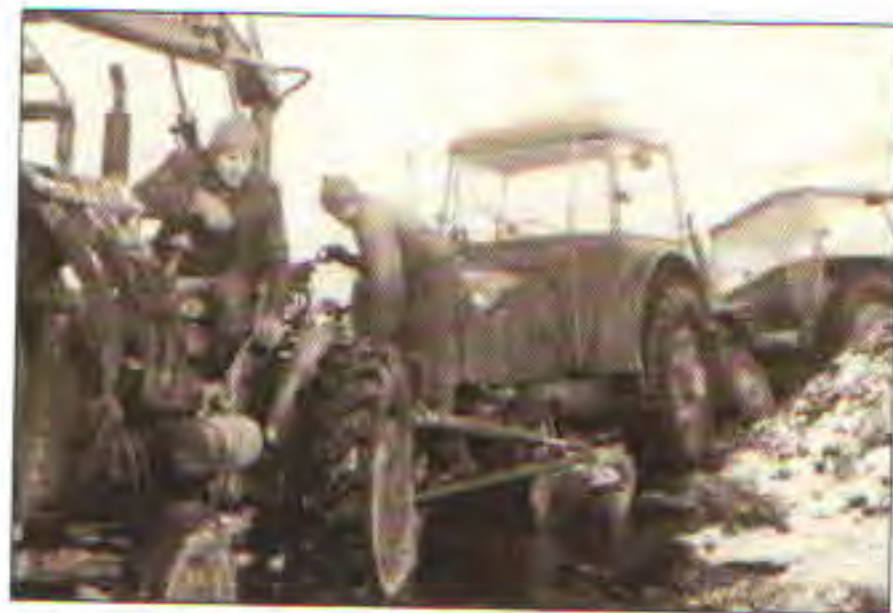
Řepná kampaň, asi 1968

Jednotné zemědělské družstvo OPROSTOVICE okr. Přerov