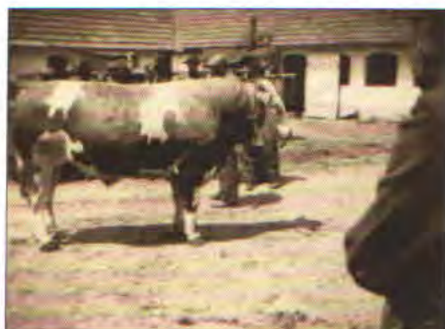
Plemenný býk v JZD