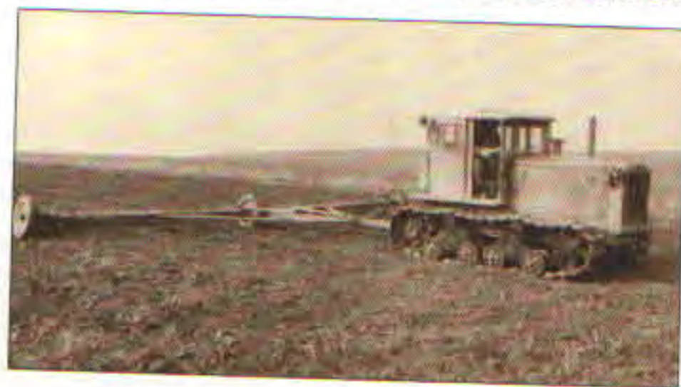
Pásový traktor při vláčení, 70. léta 20. stol.