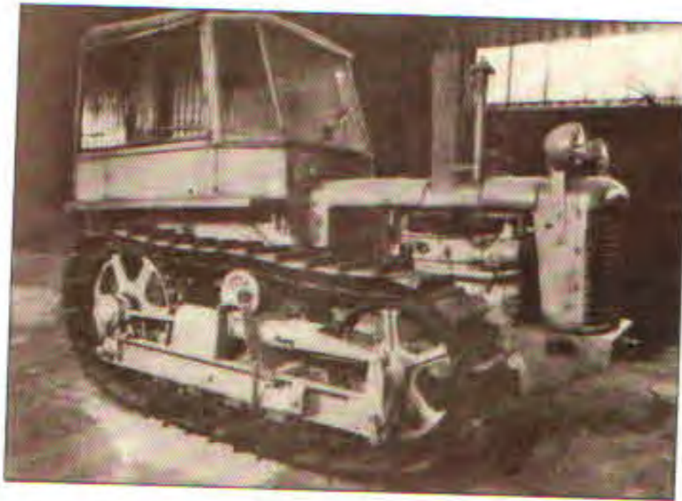
Pásový traktor Zetor 35 P