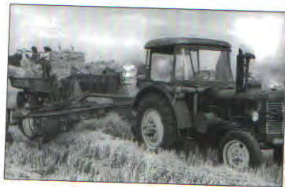
Traktor ZETOR 35 Super