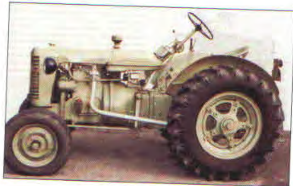
Traktor Zetor 25 s gumovými koly