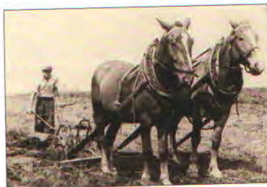
Práce na poli v Oprostovicích před založením JZD