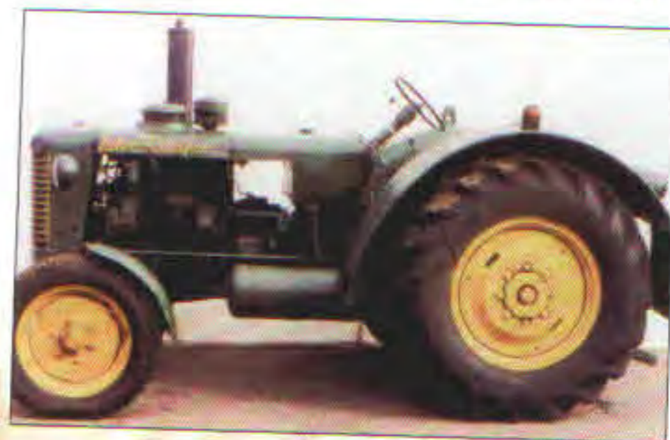
Traktor ZETOR 50 Super