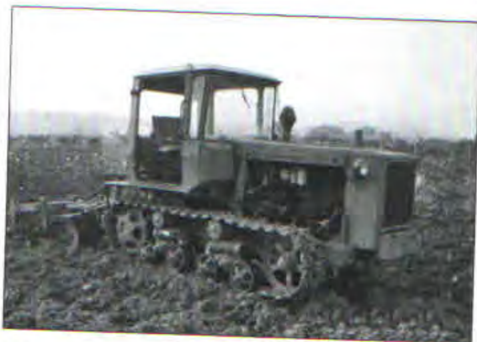
Pásový traktor dt-75