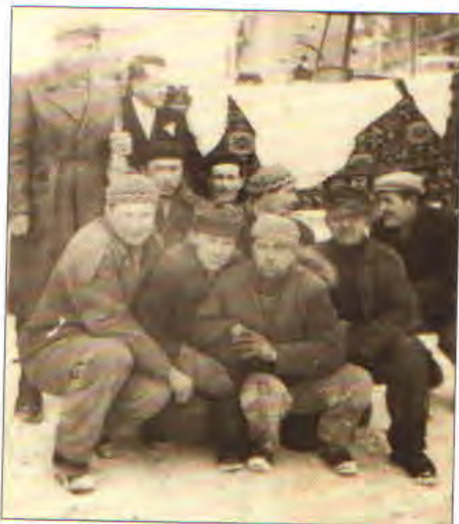
Traktoristé z JZD