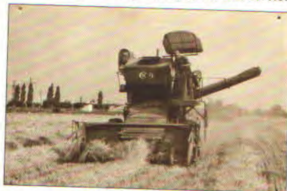
Kombajn při sklizni obilí, 70. léta 20. stol.