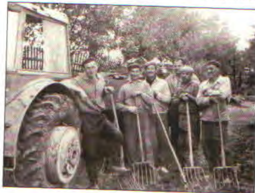
Členové družstva při práci