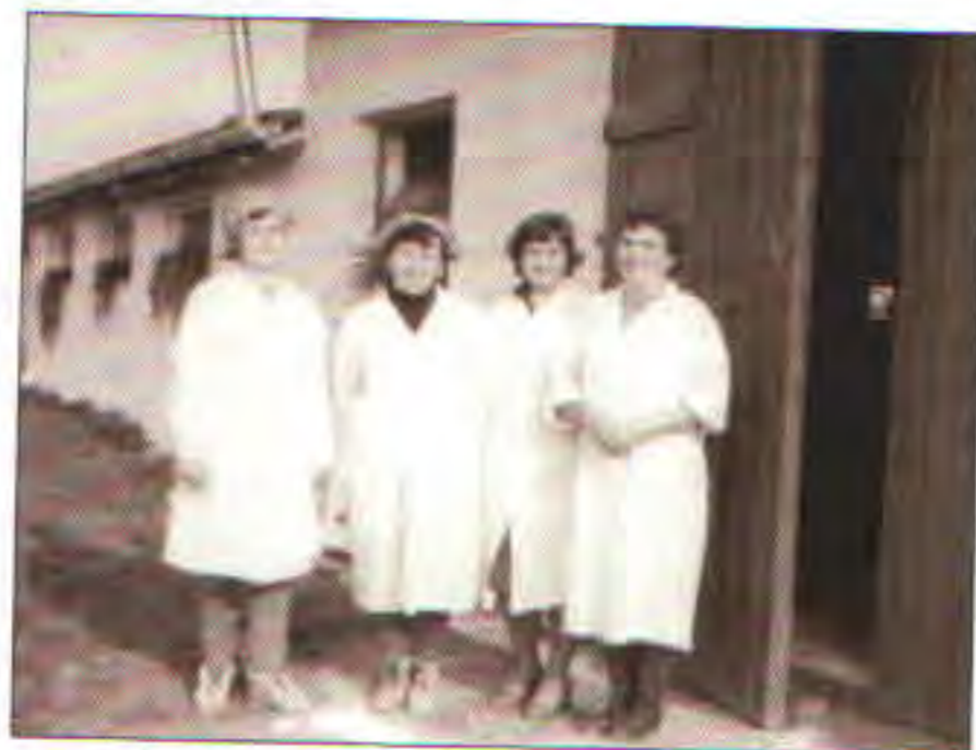
Ženy při kontrole selat ve vepříně v Oprostovicích, asi 1980

i prasata. Ve stavu bylo 16 párů koní, 1 dvouletka, 3 ročáci, pak se stav koní zmenšoval. Značnou pozornost věnovalo vedení především zajišťování mechanizace a investiční výstavbě. Již v prvním roce hospodaření byl zakoupen traktor a nákladní auto.