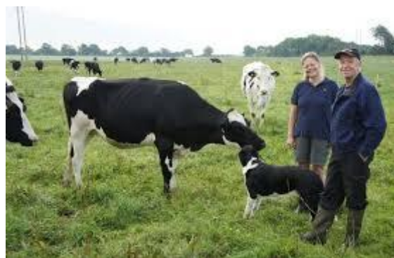
majitelé farmy Karindal

- průjezd jihozápadním Švédskem - návštěva farmy Karindal Gard nedaleko Helsingborgu: cca 400 ks černostrakatého skotu (z toho 200 krav), manželé koupili farmu před 30 lety, jejich stádo - 5. generace patří mezi nejstarší nepřetržitý chov ve Švédsku, prodej mléka výlučně do mlékárny Skanemejerier, maso do HK Scan, 225 ha půdy: obilí, cukrová řepa, kukuřice, řepka, tráva na siláž, 3 Lely roboty z r. 2011