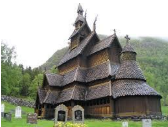
kostel v Borgundu