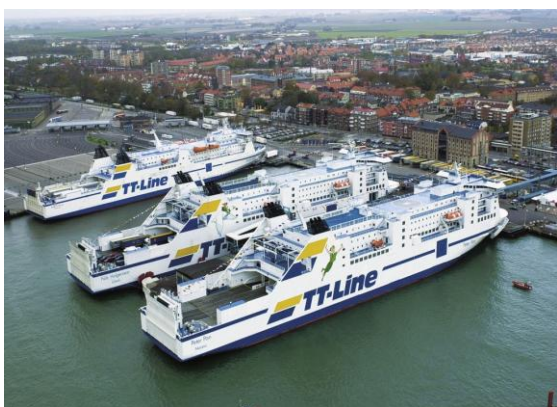
TT Line – trajekty

- přejezd Německa do Travemünde, noční trajekt do švédského Trelleborgu - pohodlná plavba, čtyřlůžkové kajuty v ceně zájezdu (dvoulůžkové kajuty za příplatek – viz „Doplňkové služby“, dále jen DS), možnost občerstvení, nákupů, atp. Doporučujeme připravit si malou tašku na trajekt (toaletní potřeby, malý ručník, apod.), kterou si vyzvednete ze zavazadlového prostoru autobusu před nástupem na loď. V průběhu plavby (cca 9 hodin) je přístup do autobusu zakázán; do hlavních zavazadel se dostanete až 2. den večer! Ostatní věci potřebné na cestu (doklady, peníze, deštník, fotoaparát, svačina apod.) si vezměte v příruční tašce přímo do autobusu.