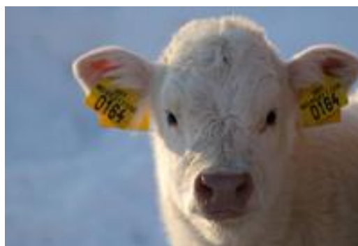
tele „Betty“ - Charolais farmy Kaldor