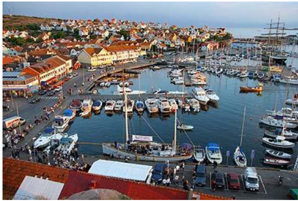
Bohusland - Kunghshamn