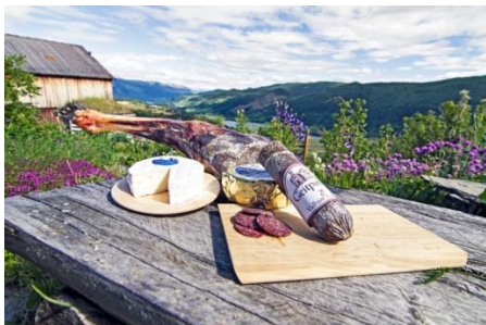
produkty kozí a ovčí farmy