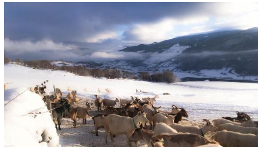
kozy v zimě