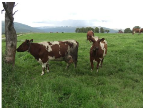
dobytek farmy Nordpa Tynol